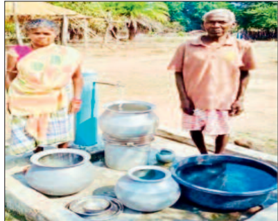
से गांव में 100 नल कनेक्शन प्रदान करने का लक्ष्य निर्धारित कर कार्य तेजी से किया गया, जिससे ग्रामीणों

सालातोंग में अब हर घर तक नल से स्वच्छ पानी पहुंच रहा है। ग्राम सालातोंग, जो कोंटा से लगभग 100 किमी तथा जिला मुख्यालय सुकमा से 90 किमी दूर स्थित है, लंबे समय तक नक्सल समस्या और पेयजल संकट से जूझता रहा। गांव के लगभग 80 घरों के लोग पीने और घरेलू उपयोग के लिए एक छोटे नाले पर निर्भर थे। गर्मी के मौसम में जब महीनों तक बारिश नहीं होती थी, तब नाले का जलस्तर इतना घट जाता था कि ग्रामीणों को बेहद सीमित मात्रा में पानी निकालना पड़ता था। कई बार पानी के लिए लंबी दूरी तय करनी पड़ती थी, जिससे बच्चों, महिलाओं और बुजुर्गों को विशेष परेशानी होती थी। अब जल जीवन मिशन के माध्यम